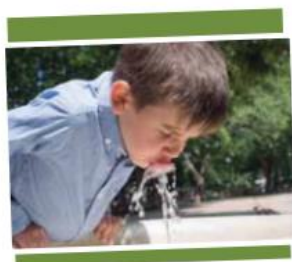
El agua que bebemos o el sándwich que comemos están formados por una mezcla de componentes.