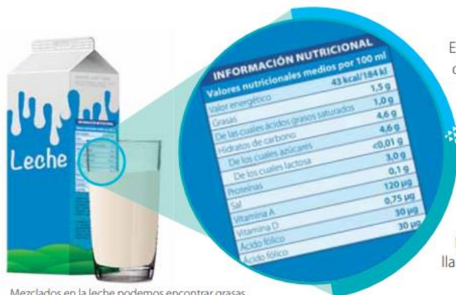
Mezclados en la leche podemos encontrar grasas, azúcares, proteínas y otros componentes.

Los materiales están formados por materia, que tiene masa y ocupa un lugar en el espacio. A diario estamos en contacto con muchos materiales y los podemos identificar como parte de diferentes cuerpos, es decir, aquellas cosas que podemos percibir con los sentidos y distinguir entre sí. Con solo observar a nuestro alrededor podemos señalar varios cuerpos a los que les damos nombres propios, como el pizarrón, el borrador, la carpeta y muchos otros, como este libro que están leyendo. Observen algunos ejemplos de cuerpos formados por materiales que, a su vez, tienen un componente o una mezcla de ellos