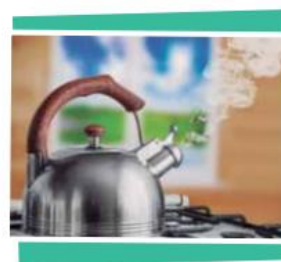
El vapor de la pava es un material formado por un solo componente: el agua.