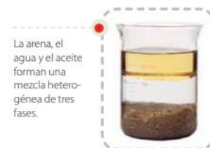
La arena, el agua y el aceite forman una mezcla heterogénea de tres fases.