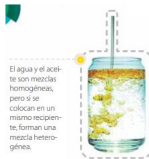
El agua y el aceite son mezclas homogéneas, pero si se colocan en un mismo recipiente, forman una mezcla heterogénea.

Las mezclas heterogéneas El agua y el aceite son dos materiales que, cada uno por separado, son mezclas homogéneas. Pero al combinarlos conforman una mezcla heterogénea. Inclusive si revolvemos con una cuchara ambos materiales, tarde o temprano volverán a ser diferenciables uno del otro con facilidad. Ambos líquidos tienen características muy distintas entre sí, y por este motivo podemos identificarlos por separado fácilmente cuando forman parte de una mezcla. Como estudiaron, llamamos mezclas heterogéneas a las que tienen dos o más partes que pueden distinguirse. Cada una de las partes se denomina fases, que tienen propiedades características – como color, sabor o textura–, y por eso es posible diferenciarlas unas de otras. En el caso de la mezcla de agua con aceite, a simple vista notamos que tienen distinto color y, por lo tanto, hay dos fases. Vean algunos ejemplos de mezclas heterogéneas que utilizamos en nuestra vida cotidiana.