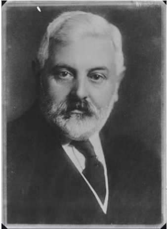
Retrato de Ambrosetti.

El folklore trata de tradiciones, de hechos sociales, estéticos, compartidos por la población y que suelen transmitirse de generación en generación. Nos habla de un saber popular que incluye los bailes, la música, las leyendas, los cuentos, las artesanías y las supersticiones de la cultura local, las coplas, entre otras manifestaciones multidimensionales.