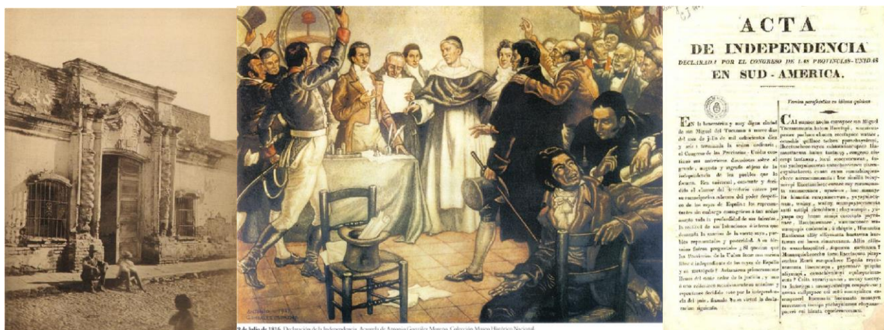
9 de julio de 1816. Declaración de la Independencia. Asamblea de Anónima General Murosa. Colección Museo Histórico Nacional.

Finalmente, y después de arduas discusiones, el 9 de julio de 1816 los representantes firmaron la declaración de la Independencia de las Provincias Unidas en Sudamérica y la afirmación de la voluntad de ser “una nación libre e independiente del rey Fernando VII, sus sucesores y metrópoli y de toda otra dominación extranjera” .