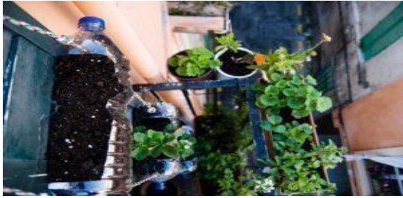
M aterial Grafico presentado