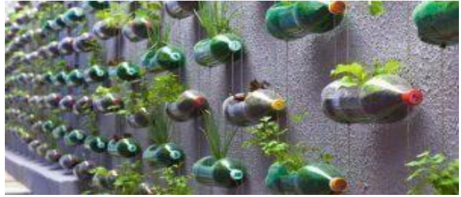
a los alumnos /as al inicio del Proye cto