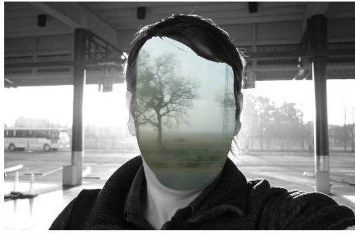
Escuela 5 –fotomontaje Juárez