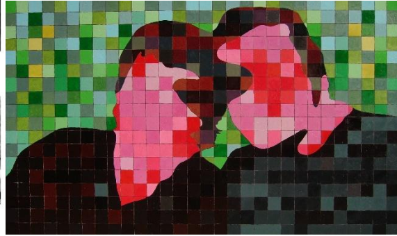
540 pixeles –pintura Rolo Juárez (2013)