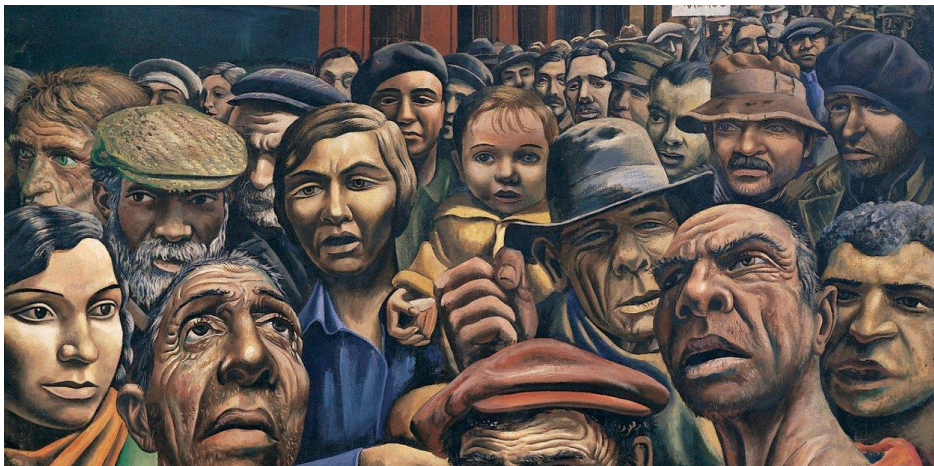
"Manifestación y desocupación" (1934), de Antonio Berni.

Ícono del arte argentino y emblema de la Colección Malba