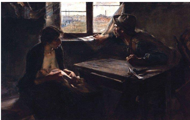
"Sin pan y sin trabajo", de Ernesto de la Cárcova, de 1894.

El Nuevo Realismo , busca representar la realidad espiritual, social, política y económica de ese momento histórico. En Manifestación , rostros y expresiones conforman una gran manifestación que pide por “pan y trabajo” –la pancarta se ve al fondo de la pintura, como si fuera un detalle menor, pero no lo es– en alusión directa a la obra Sin pan y sin trabajo , el cuadro emblema del realismo social argentino de Ernesto de la Cárcova, de 1894.