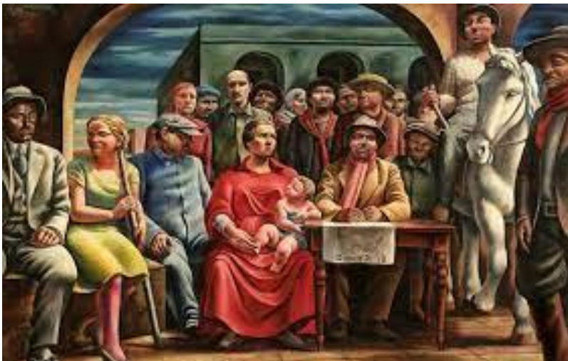
"Los chacareros" 1934

Ese mismo año, en 1934, Berni produjo otra de las pinturas emblema del arte argentino, Desocupados , que junto con Chacareros , forman un tríptico sobre la crisis económica de la época .