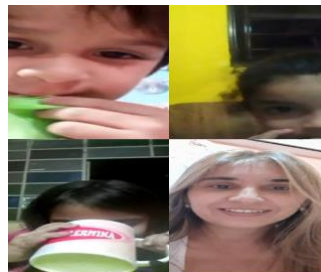
Video llamadas con grupos reducidos para hablar sobre el tema