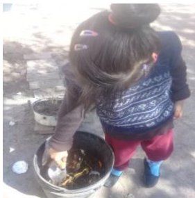
Armado del compost (picar los desechos mezclar con tierra)