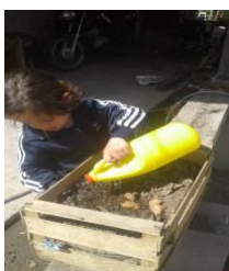
Regar a diario el compost (mantener humedad)