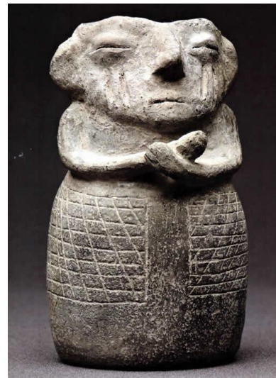
Figura femenina: vasija modelada en cerámica, con representación de falda decorada por cuadrículado y con representación de tatuajes en la cara. Alto 14,5 cm.