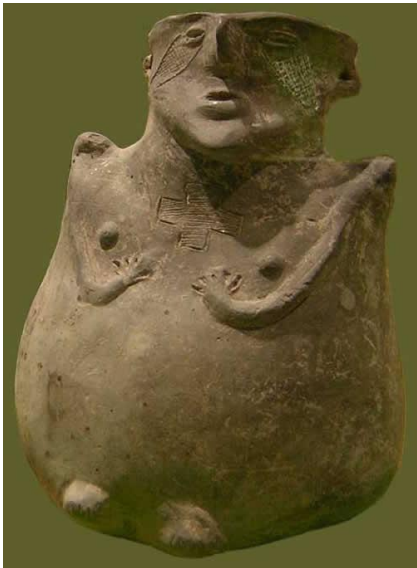
Figura femenina con decoración incisa. Lleva en su pecho un grabado cruciforme. Alto 15,5 cm.