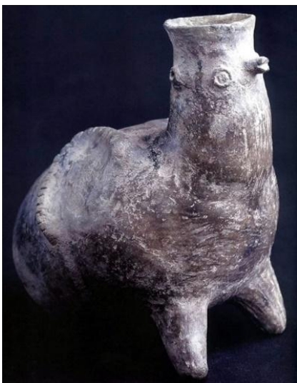
Vaso zoomorfo en cerámica gris con decoración incisa. Período Temprano. Alto: 17 cm. Largo: 16 cm.