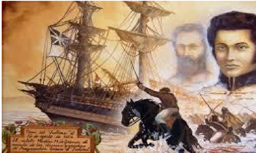
Toma de la fragata inglesa Justina , óleo de Juan Francisco Cancio Lazo