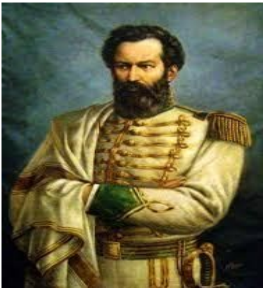
Retrato de Güemes de Eduardo Schiaffino, 1902

https://www.educ.ar/recursos/130946/guemes-y-la-revolucion-en-el-noroeste