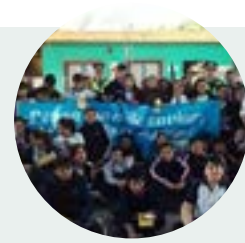
Macro jornadas preventivas

Este proyecto apunta a motivar a las personas a nutrirse con la información que brinda el PSI y que a su vez puedan comunicarlo a otros, reforzando así comportamientos preventivos en la ciudadanía. Para ello, el equipo de la Secretaría de Participación Ciudadana diseñó un ciclo de capacitación basado en una metodología de enseñanza aprendizaje participativa. A través de esta red preventiva, vamos tejiendo entre todos vínculos sociales más fuertes y solidarios a favor de la participación ciudadana y la convivencia pacífica.