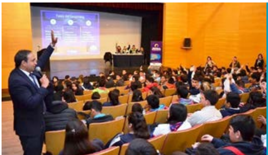
Municipalidad de San Isidro de Lules. Casa de la Cultura. 31 de agosto de 2016.

En el marco de las campañas Juntos Es Más Seguro y Tejiendo Redes, desde la Secretaría de Estado de Participación Ciudadana del Ministerio de Seguridad, junto a la Secretaría de Estado de Bienestar Educativo del Ministerio de Educación y sumando a intendencias del interior de la provincia, llevamos adelante jornadas preventivas dirigidas principalmente a estudiantes de nivel primario y secundario, con el propósito de aportar una nueva perspectiva sobre el uso responsable de las TICs y que a su vez, ellos puedan incorporar -mediante una reflexión crítica- formas más seguras de interactuar en espacios digitales.