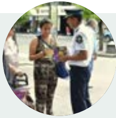
Acciones preventivas en la vía pública