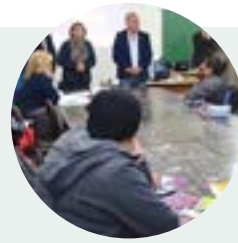
Capacitación en herramientas preventivas