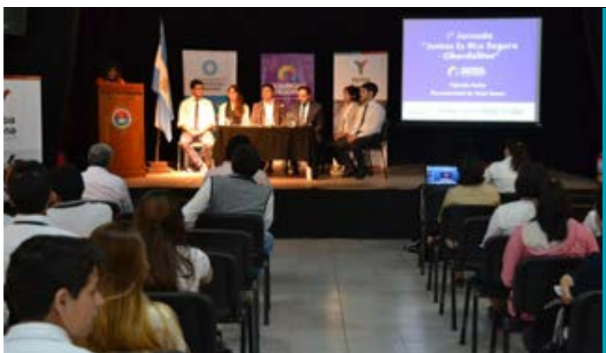
Municipalidad de Yerba Buena. Casa de la Cultura. 11 de noviembre de 2016.